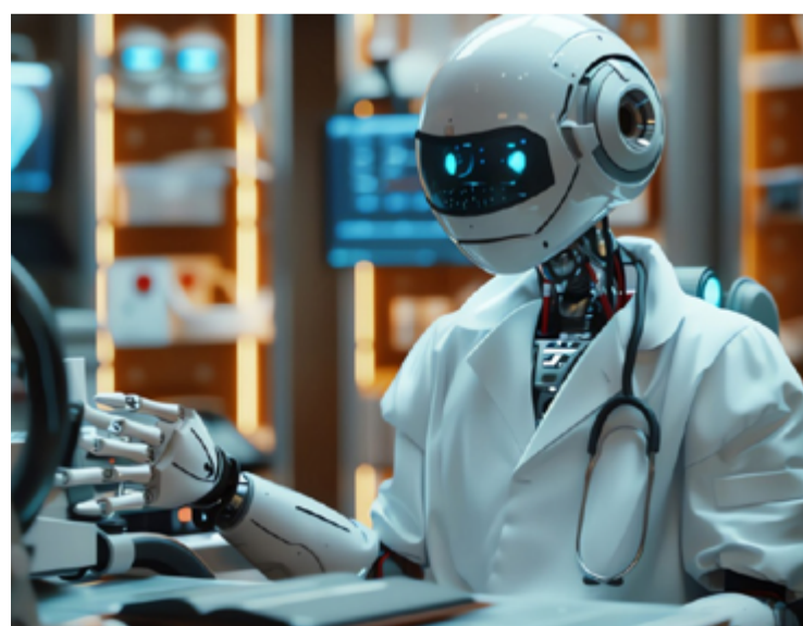
Agent Hospital é capaz de atender até 3 mil enfermos por dia

Os agentes médicos do hospital foram treinados com o conjunto de dados MedQA, utilizado no Exame de Licenciamento Médico dos EUA, e alcançaram uma taxa de precisão de 93,06% em diagnósticos de doenças respiratórias. Este nível de precisão supera significativamente a média de muitos profissionais humanos, destacando o potencial da IA em complementar e, em certos casos, superar o desempenho humano em áreas específicas da medicina. Impacto e Inovação.