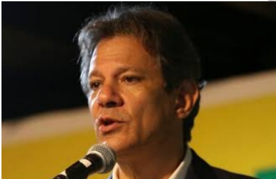
Ministros da Fazenda, Fernando Haddad, e do Desenvolvimento Social, Wellington Dias, estão em busca de soluções para maior desafio do governo: cortar para investir

Em 2025, o governo espera poupar pelo menos R$ 25,9 bilhões com essas ações. As medidas incluem revisões cadastrais no BPC (Benefício de