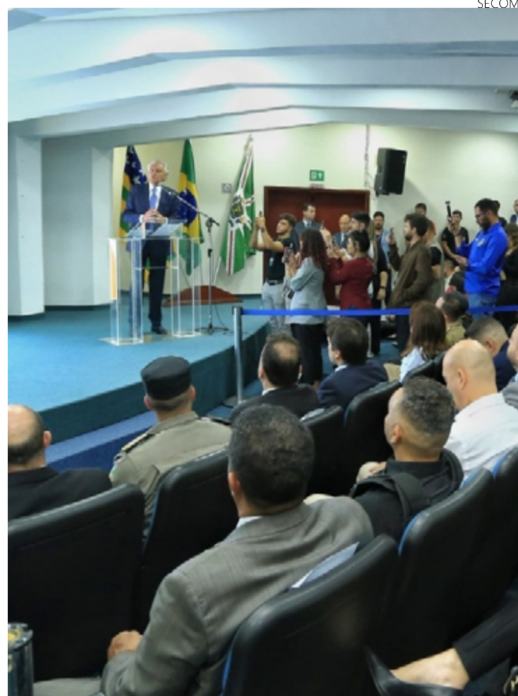
Governador Ronaldo Caiado e equipe da Segurança Pública analisa redução dos índices de criminalidade desde 2018

SSP-GO (1º semestre 2018 / 1º semestre 2024)