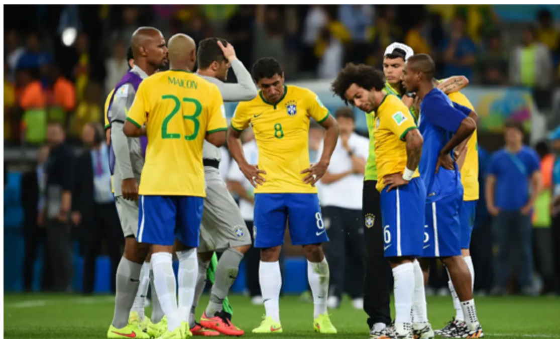
Fracasso estrepitoso: seleção viria a levar três da Holanda, em Brasília, pelo terceiro lugar

posto desprivilegiado no capitalismo internacional, com índices aquém do aceitável em matéria educacional e refém de delírios dos militares, o Brasil melhorou autoestima de seu povo por meio dos dribles de Garrincha na Copa de 58, dos acordes de João Gilberto em “Chega de Saudade” e das harmonias minimalistas tocadas por Tom Jobim.