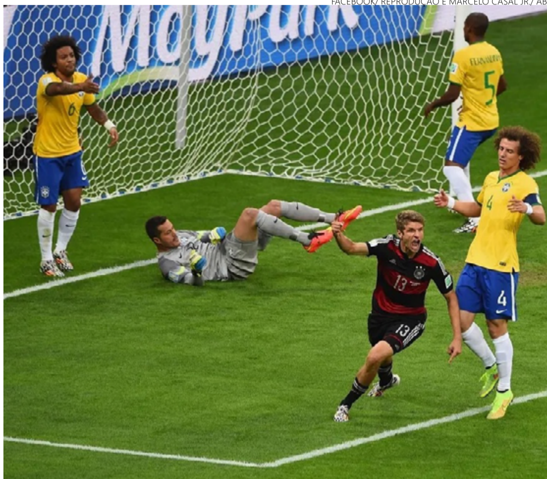
Ataque alemão: Thomas Müller marca mais um gol na vexatória semifinal da Copa de 2014

Daí conclui-se ser sério o breu em que nos metemos. Tão sério quanto risível. Ocupando