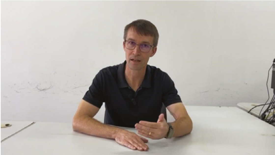
Fernando Diniz alerta que, se o candidato pedir voto antes do prazo, pode pagar multa e ter as penalidades da lei eleitoral