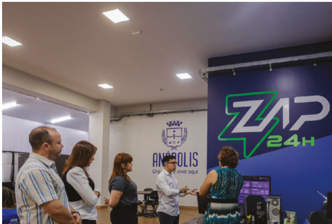
Na visita integrantes da SECTI viram o funcionamento e os benefícios da ferramenta, que tem mais de 568 mil atendimentos

Além disso, o balanço mostrou que 91% dos usuários avaliam positivamente a ferramenta, com notas a partir de 7 indicando aprovação do atendimento. "Com o Zap 24h, trouxemos a modernidade para Anápolis e estreitamos o vínculo entre a Prefeitura e o cidadão, que agora pode solicitar qualquer serviço que o po-