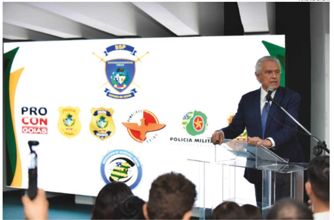
"De todas as áreas, a segurança pública é a que mais avançou no meu governo", afirmou o governador Ronaldo Caiado