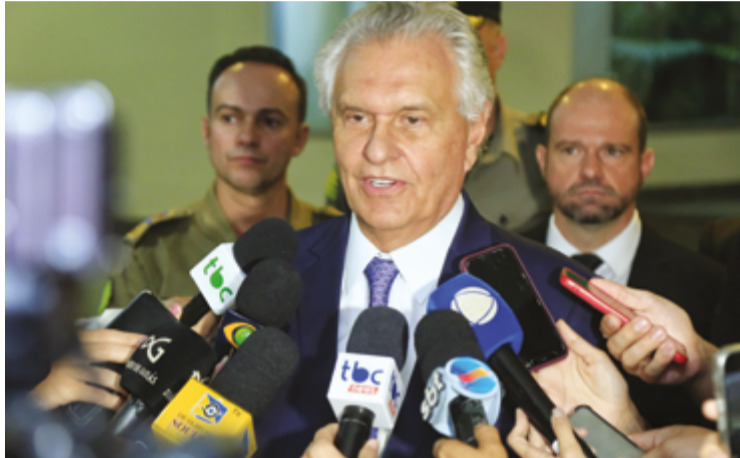
Governador Ronaldo Caiado assina decreto que simplifica legislação para abertura de novas empresas, diminui a burocracia e estimula o empreendedorismo

Lei Estadual especifica o parâmetro usado para classificação das atividades econômicas de baixo risco, com o objetivo de ampliar a livre iniciativa