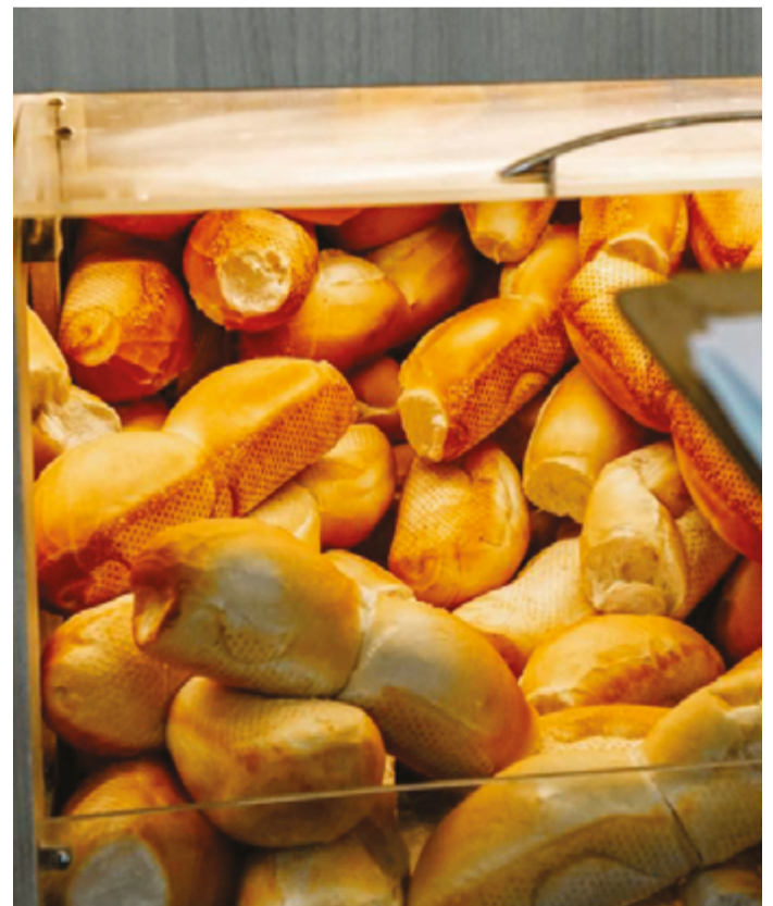
Pão francês, queridinho na mesa, de R$ 10,98 a R$ 16,99, 55% de oscilação